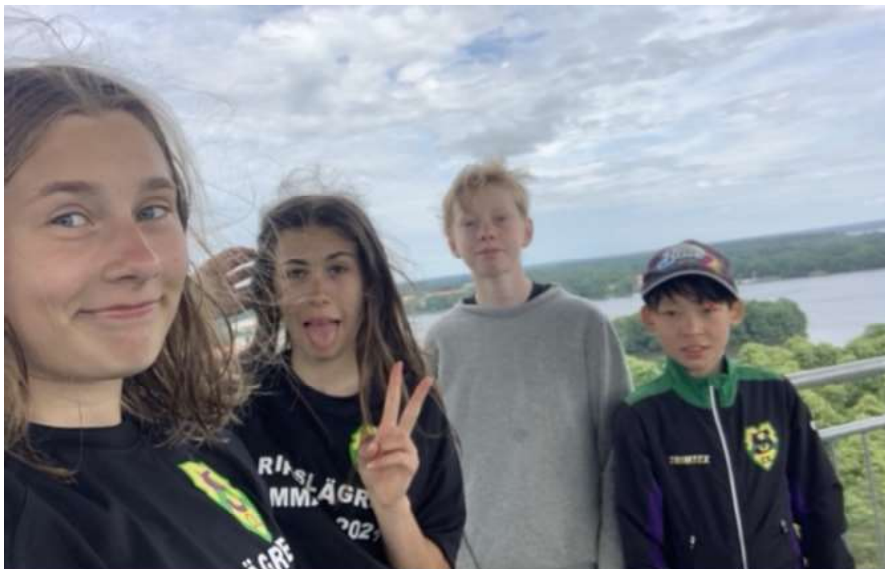
Segrande lag på aktivitetsdagen tog detta fantastiska kort från Kungstornet

Det var fyra orienteringsdagar med förmiddag och eftermiddagspass inklusive teori bad stöj och annat. Mitt i veckan var det en aktivitets dag då barnen uppdelade i grupper tävlade om att känna till saker om Strängnäs. Där ingick även en station vid brandkåren där man skulle livrädda en docka och släcka en påhittad brand.