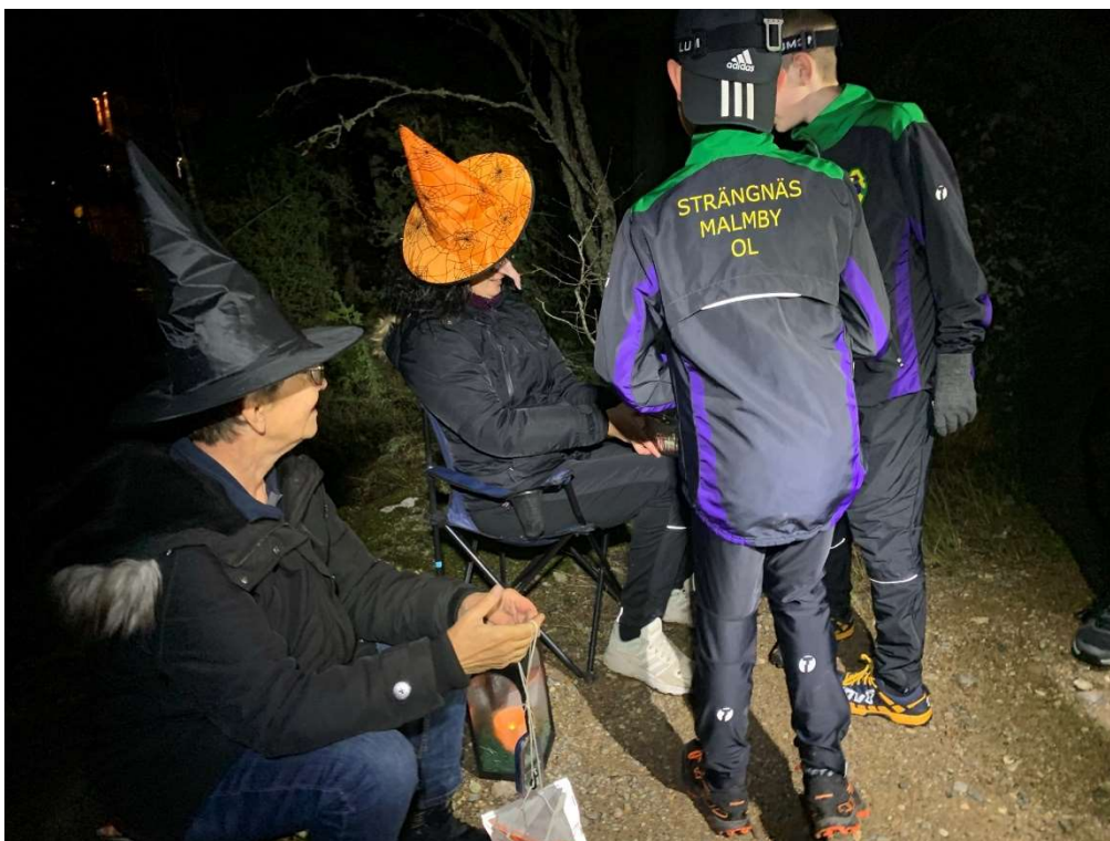
Stämpling vid häxorna där man fick godis om man var snäll

Söndag 12/12 var 9 ungdomar + 4 ledare/föräldrar med på en första gemensam träningsdag som vi blev inbjudna att delta i tillsammans med Eskilstunaklubbarna EOL, Ärla IF, OK Tor. Planen för 2022 års träningsdagar är EOL 16/1, OK Tor 13/2 och SMOL 13/3.