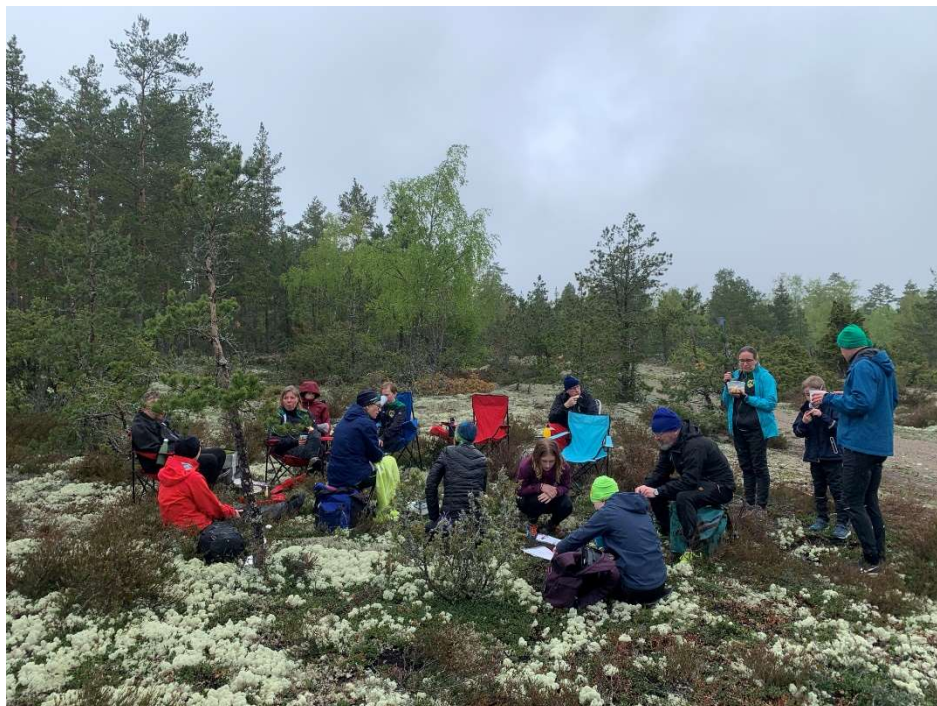
Matsäck i duggregnet efter träningen i Kjula

Helgen 15/-16/5 hade vi en Träningshelg med orienteringsbanor i andra skogar. 25 deltagare deltog vid Kjula på lördagen och 24 deltagare strax utanför Enköping på söndagen.