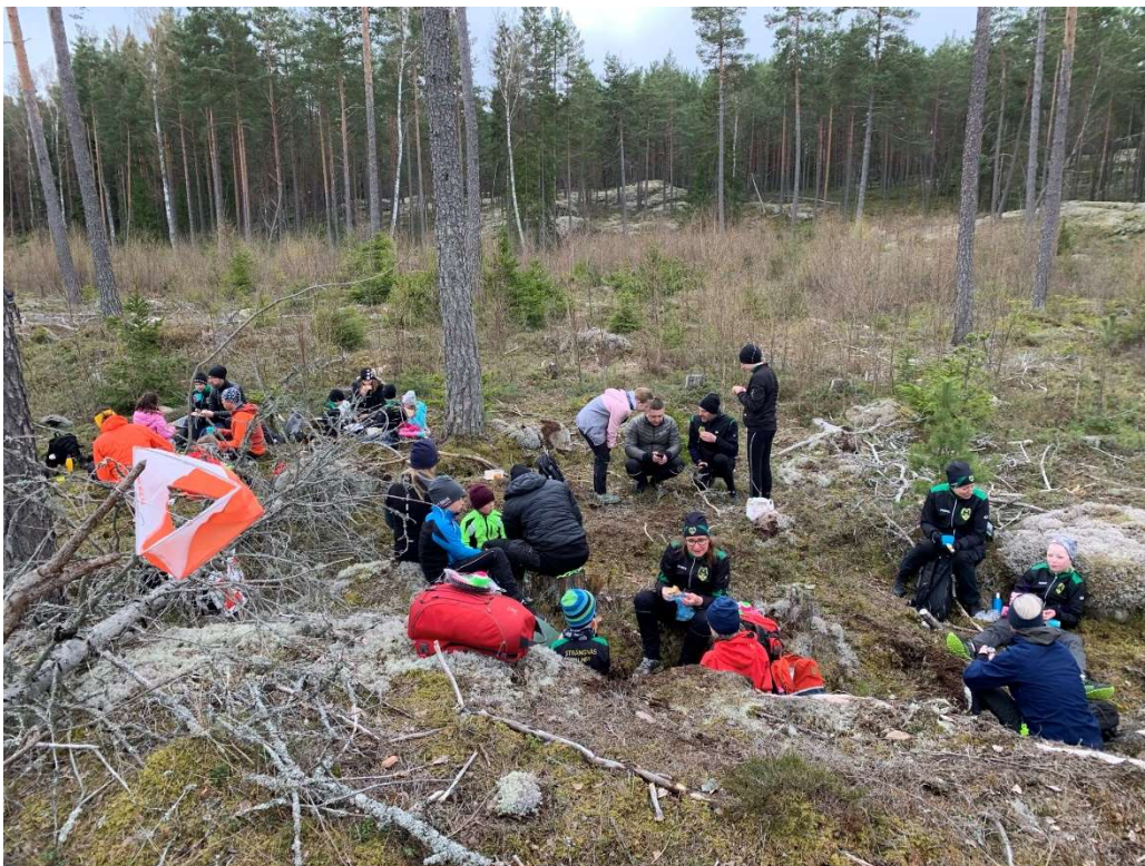
Matsäck ute i skogen

Det var Poker-OL vid Märinge på lördagen med prisutdelning och intag av matsäck efteråt. På söndagen hade vi en linjeorientering med uppdrag i Stadsskogen.