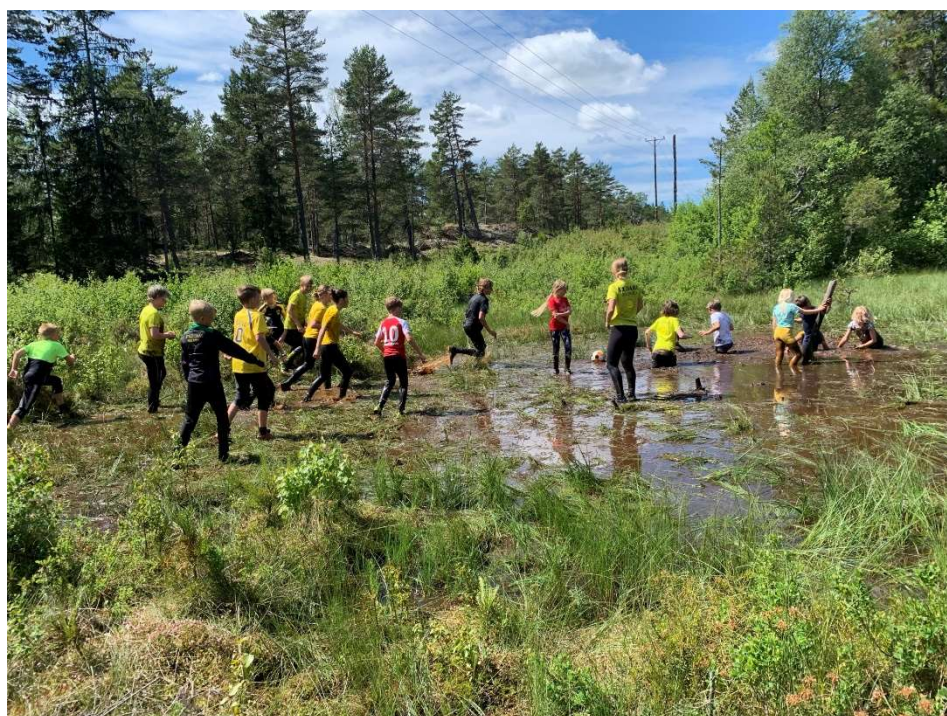
Mossfotboll som avslutning på SOL-skolan