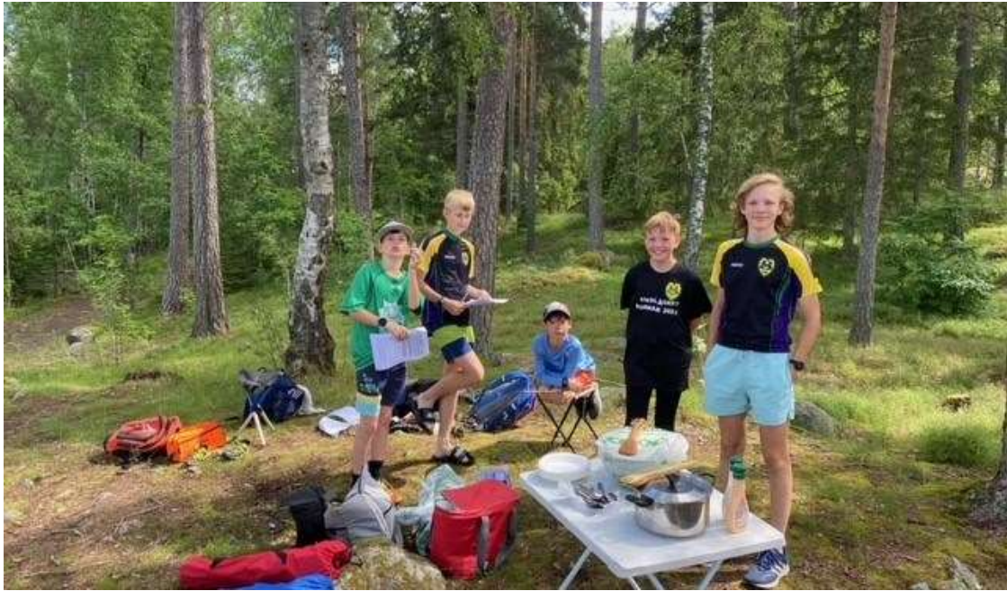
Matpaus ute i skogen

Torsdag 5/8 startade vi höstens torsdagsträningar igen och höstens orienteringsupptakt var torsdag 19/8.