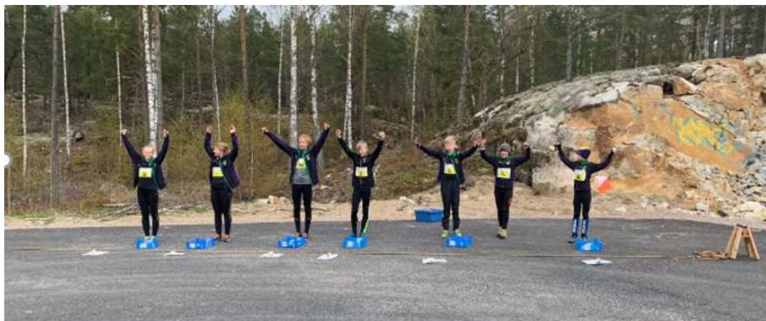
Tävlande på sträcka två gör sig redo för start