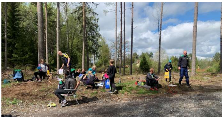
Matsäck och ombyte efter träningen utanför Enköping

Årets Mossfotbolls -match avgjordes måndag 7/6 i en blöt mosse i Stadsskogen.