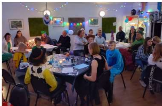
Poängorientering & Årsfest