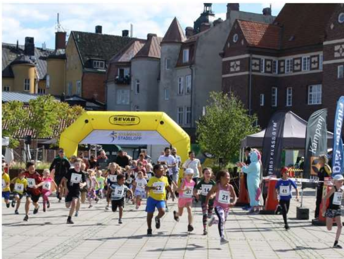
Starten har gått för de yngre deltagarna i Stadsloppet

Det mindre HittaUt projekt som genomfördes under tre månader 2020 följdes upp av ett större och längre projekt 2021. 160 kontroller, sk. checkpoints sattes ut i centrala Strängnäs, på Tosterön, Tingstuhöjden, Stadsskogen, i Åkers styckebruk samt i Mariefred. HittaUt genomfördes den 1 april till 12 oktober, och projektet var ett samarbete med främst OK Grip. Under säsongen hämtades ca 7 000 kartor från våra utlämningsställen, drygt 1 200 deltagare registrerade tillsammans drygt 45 000 checkpoints genom att röra sig nästan 90 000 km i över 33 000 timmar. 68 personer registrerade samtliga 160 checkpoints och många delade på sociala medier med sig om sina äventyr i både ord och bild. En fin marknadsföring av både vårt projekt och kommunen. Året avslutades med ytterligare ett mindre HittaUt-projekt då Mitt Strängnäs, företagare i centrala Strängnäs, efterfrågade ett samarbete för att öka intresset för julhandeln i centrum.