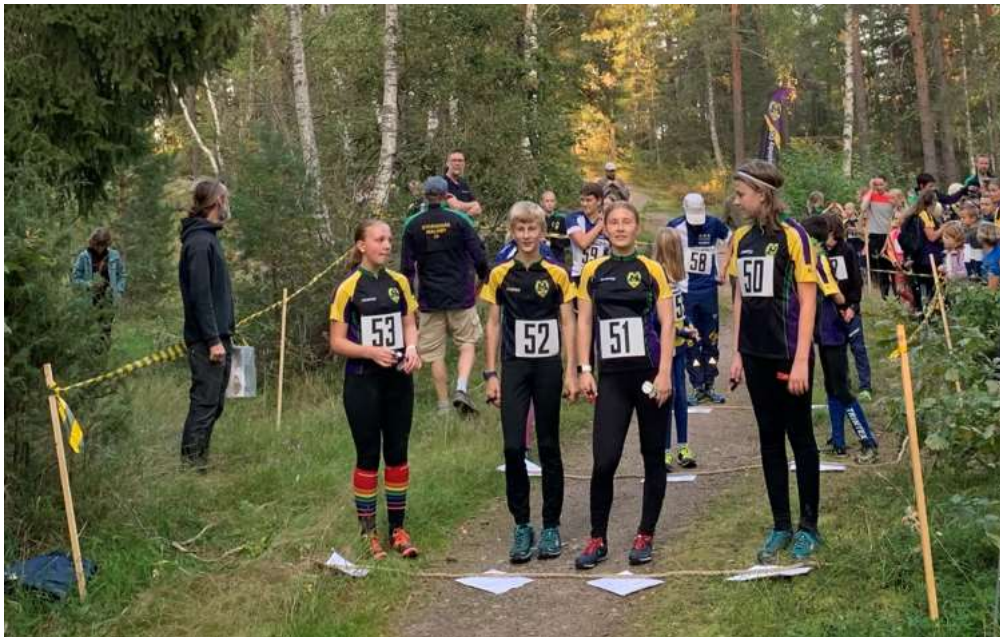
Dags för start på Ungdomscupen

Vi arrangerade Ungdomscupen som en stafett på Tingstuhöjden 9/9 med deltagare från SNO och SMOL. Vi hade 29 deltagande barn- och ungdomar + ledare och föräldrar.