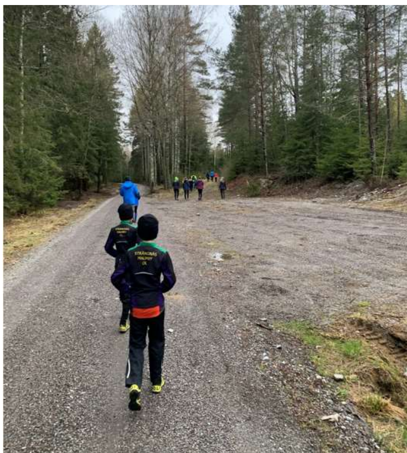
På väg till start, Ungdomscupen i Södertälje.

Torsdag 6/5 var vi inbjudna av SNO till Tveta friluftsgård i Södertälje för att springa Ungdomscup . 23 ungdomar från SMOL sprang banor med varierande svårighetsgrad.