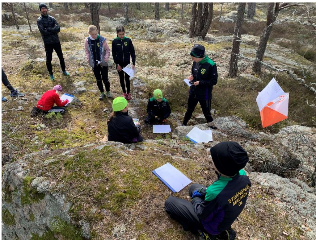
Ett uppdrag på skogslekshelgen var att rita så många kartecken man kunde

Lördag 1/5 var delar av orienteringslandslaget i Strängnäs för en sprint-träning inför EM. Thierry Gueorgiou hörde av sig och ville gärna lägga banor på vår sprintkarta i centrala Strängnäs. Vi tog tillfället i akt och frågade om vi fick vara med och heja på, vilket blev väldigt lyckat trots att vi var tvungna att hålla avstånd.