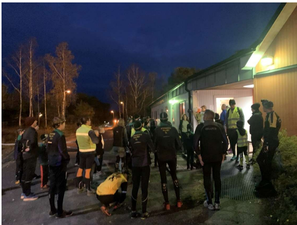
Samling inför en av höstens torsdagsträningar