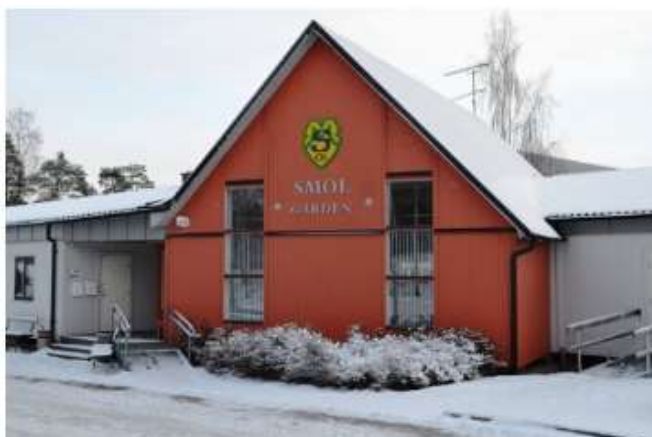
Vår fina klubbstuga

Under året har en fast Internetanslutning till Cykelklubbens lokaler installerats genom den fiberanslutning som finns till SMOLgården. Nu kan Cykelklubben köra spinningpass med cyklar och storbildskärm uppkopplade till de "Spinning-hemsidor" som finns på nätet.