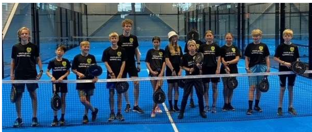
Riksläger-deltagarna provade på Padel

Även om det inte var något orienteringspass denna dag så fick de över en mil i benen på cykel i stället plus ett paddelpass i Strängnäs nya paddelhall, minigolf på visholmen. Olika föräldrar fick medverka till skjuts till skogar i närheten och även laga lunch till deltagarna de olika dagarna. 13 ungdomar deltog på detta Alla deltagare utvecklades helt säkert mycket och blev troligen också ännu sammansvetsade efter veckan.