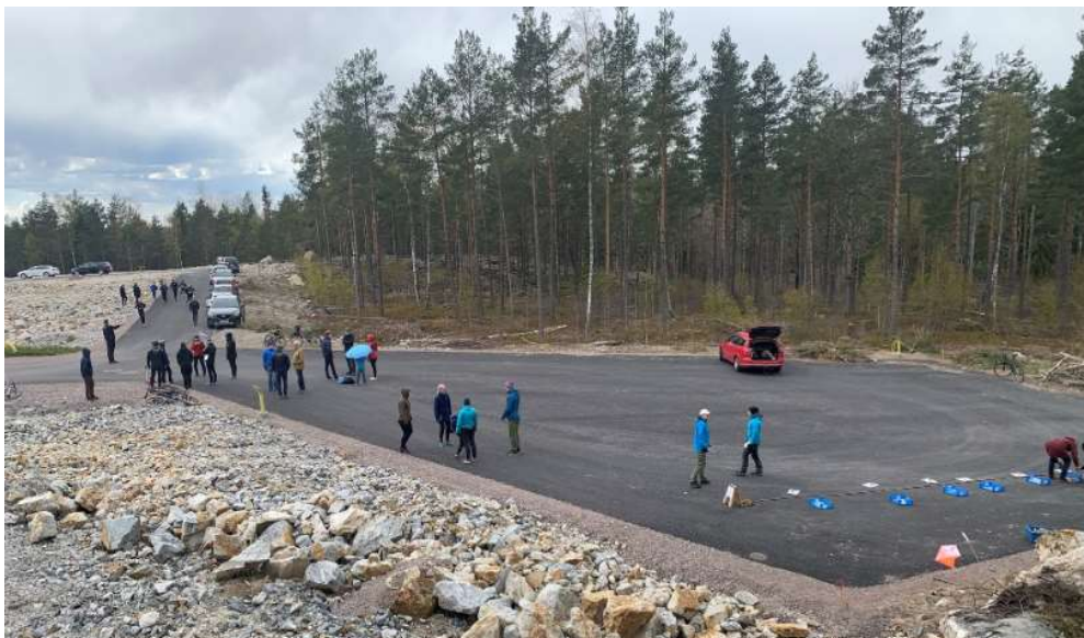
Utsikt över starten på Tosterön