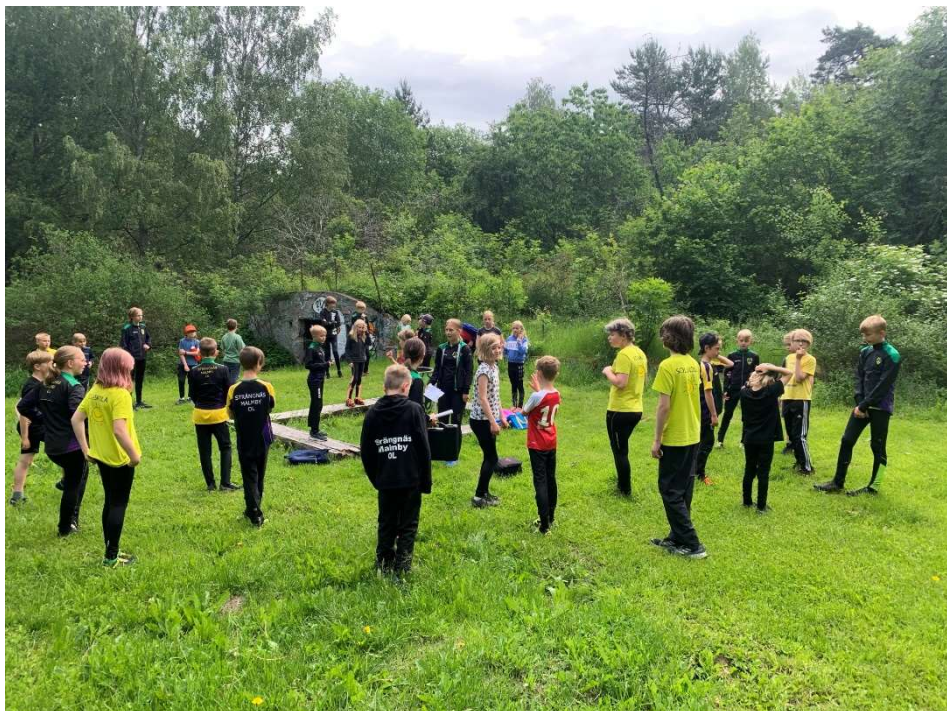
Samling inför 2-mannastafett på årets SOL-skola