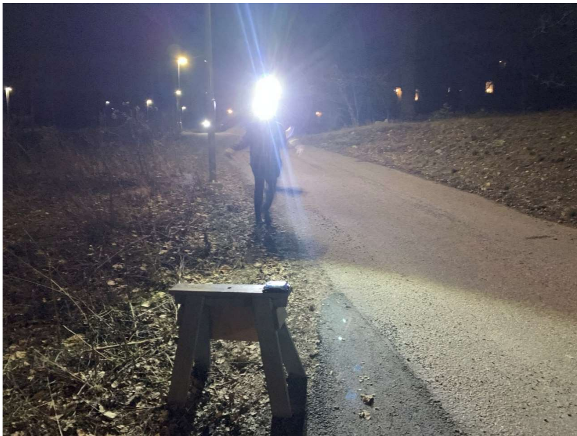
Målspurt på en av nattcuperna