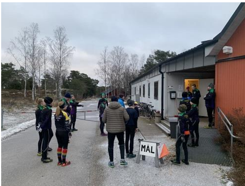
Samling inför årets nyårspoängorientering.