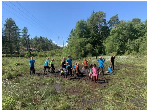
Tarzanbana och mossfotboll på årets SOL-skola